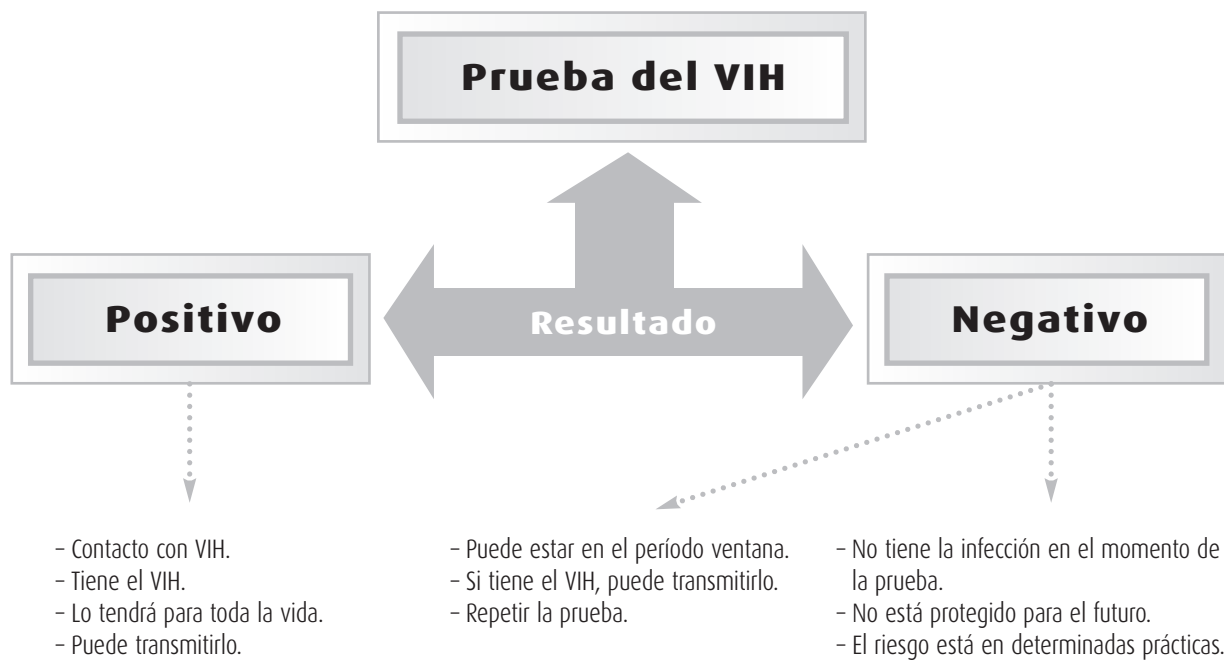
Diagrama de los resultados de la prueba del VIH