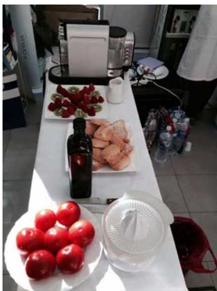
Mesa para desayunos instalada en la botica

Con ocasión de la charla sobre alimentación para un envejecimiento saludable, pude ver la proactividad e implicación de Irene Alcaraz. El acto, que tuvo lugar por la tarde del día 26 de mayo pasado, fue publicitado durante los días anteriores en el escaparate, en la botica y en la cuenta de Facebook; además, fue promocionado durante la mañana del día indicado mediante la invitación en la botica a desayunos individuales acordes con la dieta mediterránea; véase la foto.