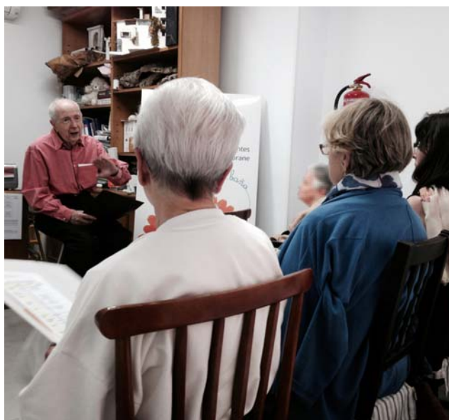
Asistentes a la charla sobre alimentación para un envejecimiento saludable